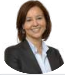
Av. Aysel Ölçen Aydın

Veri Lokalizasyonu: 5G ağlarında verinin "uç birimlerde" (edge computing) işlenmesi, verinin fiziki olarak nerede bulunduğu ve hangi devletin yargı yetkisine tabi olduğu sorusunu doğurur.