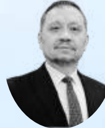
Sami DUMAN ULAK HABERLEŞME